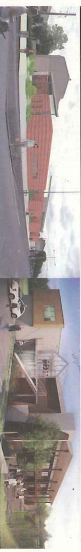
Construction Centre Médico-Psychologique Pivot à Châteauroux