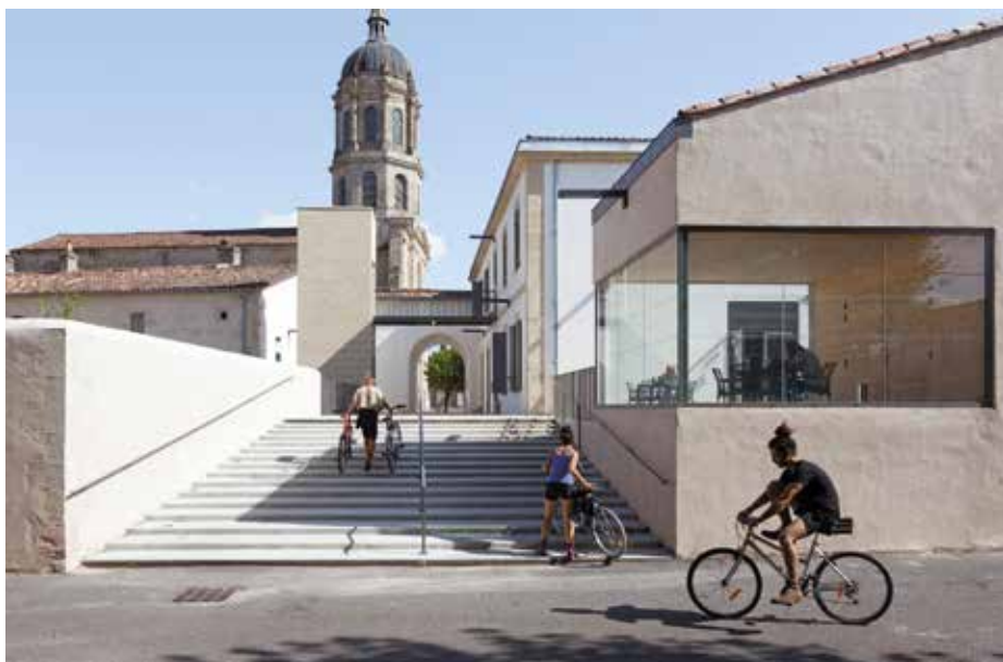
Emmarchements, préau vitré, ascenseur, arcade.