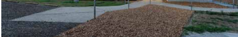
Une architecture de situation en interaction avec son milieu.