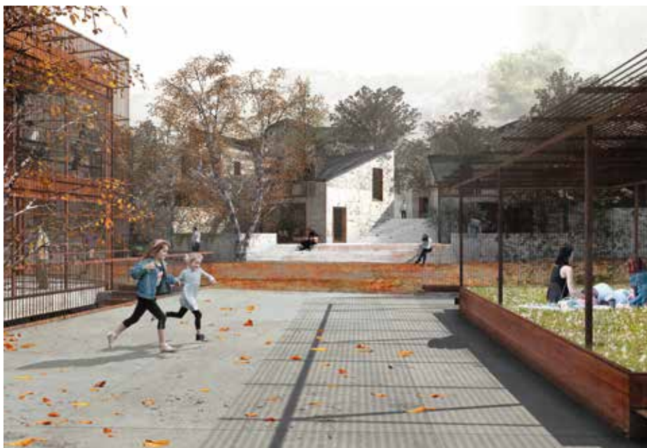
Exode urbain , logements en milieu rural.