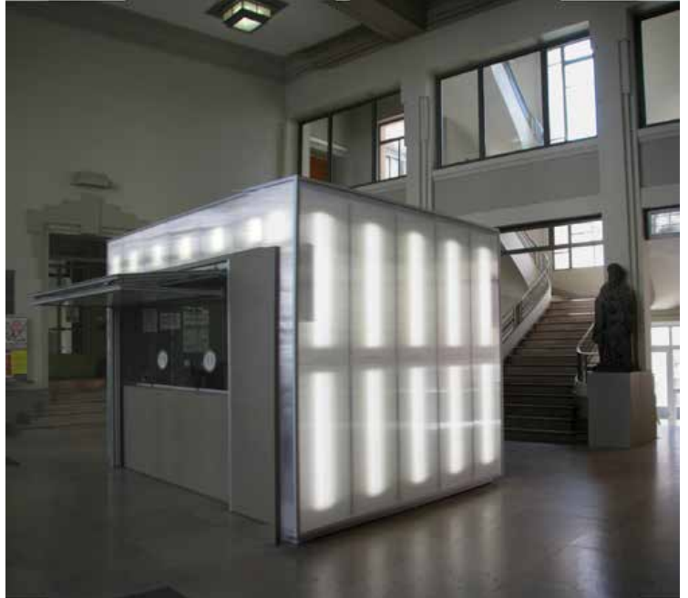
Réfection du hall et de l'escalier de la présidence Université Blaise PASCAL - Clermont Ferrand

La compréhension d'un lieu passant également par l'attention portée au patrimoine bâti et culturel, notre démarche permet, d'offrir un lien entre tradition et modernité. En effet, nous sommes convaincus que l'architecture contemporaine est un formidable moyen de préserver l'identité d'une communauté. C'est aussi une façon de valoriser l'histoire d'un lieu.