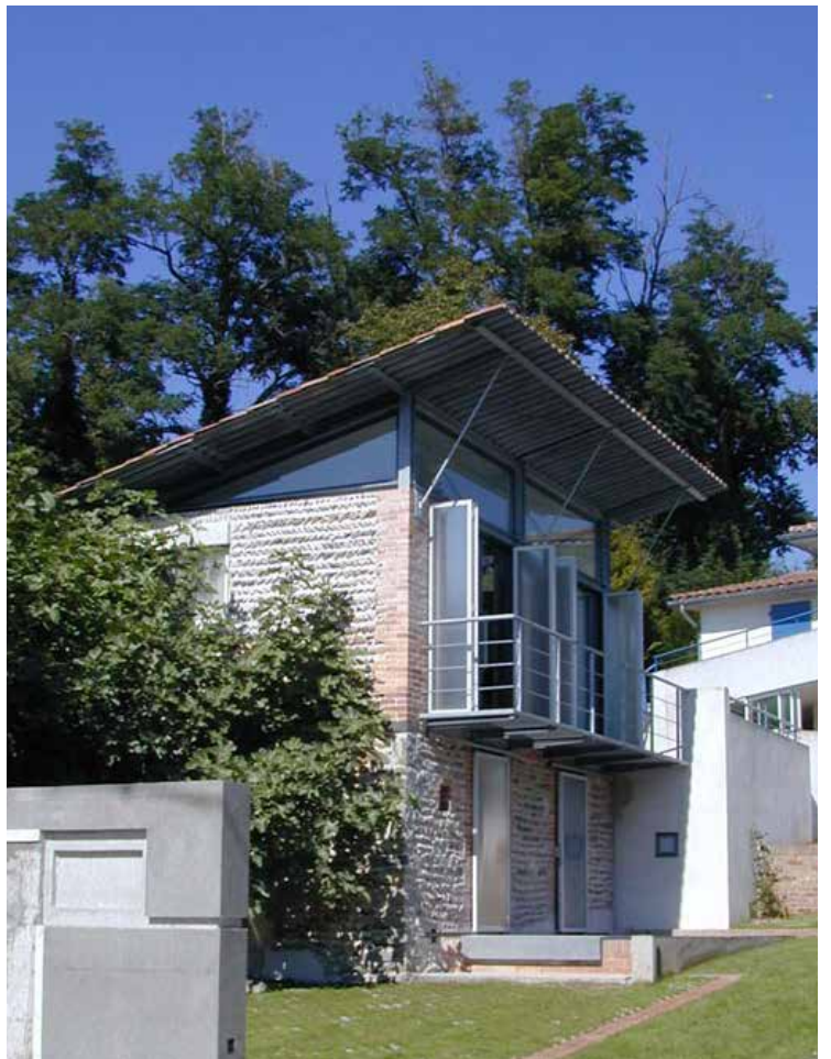
Transformation d'un séchoir en pièce de vie Prix départemental valeur d'exemple - mentionné