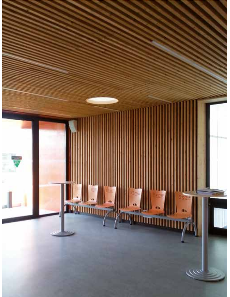
Extension et rénovation du CGFPT63 Centre de gestion la fonction publique territoriale-CFD

Déjà formée depuis plusieurs années aux nouveaux enjeux biologiques de la construction, notre agence est très sensible à la qualité environnementale des bâtiments, et donc à l'impact global de la construction sur notre environnement. Notre processus d'élaboration cherche à limiter les besoins énergétiques. Cet objectif est atteint en utilisant les orientations et les dispositifs spatiaux favorables au réchauffement et au rafraîchissement passifs, en privilégiant l'accès à la lumière naturelle, en travaillant les qualités d'ambiance dont les perceptions sensorielles et en accordant finement la production énergétique à la qualité des enveloppes. Nous privilégions ainsi la mise en œuvre de matériaux biosourcés inscrits dans l'histoire locale, permettant un travail d'expression architecturale qualitatif.