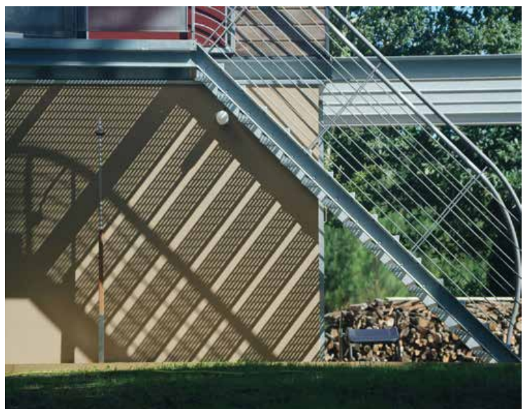
Maison de vacances pour trois générations Publiée dans le magazine «A VIVRE» - Landes