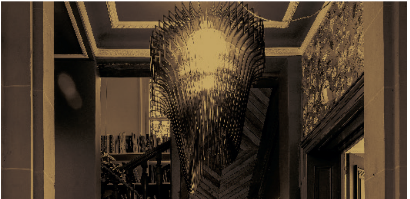
Villa Marguerite - Toulouse 31