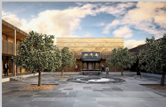
Centre de culture taoïste, Bullet, 4M