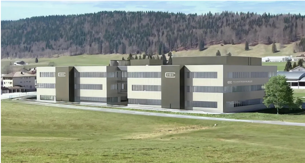
Bâtiments industriels, Le Brassus, 40M